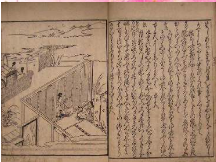
「絵入源氏小鏡」 明暦3（1657）年