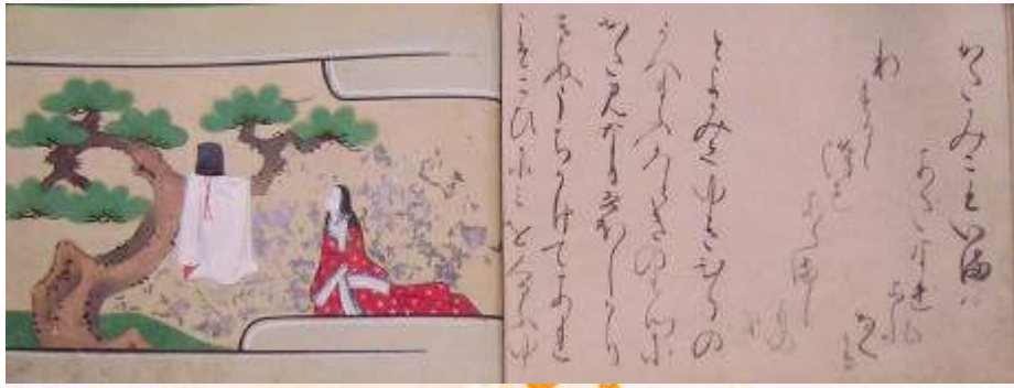
「かしはぎ」 奈良絵本 寛文元（1661）年頃