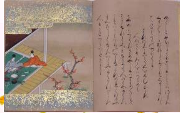
「源氏物語」 奈良絵本