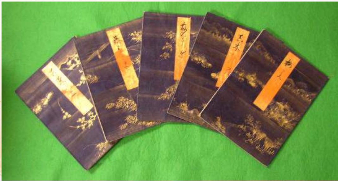
「源氏物語」 嫁入本 江戸時代中期