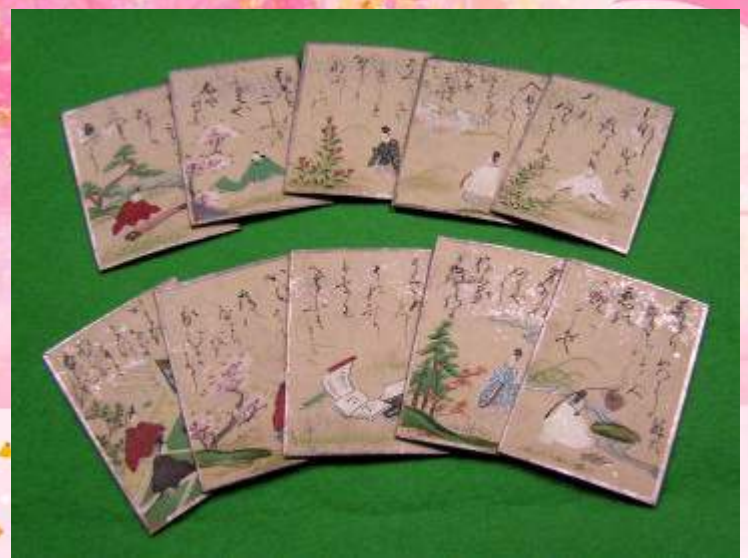
「源氏物語」かるた 江戸時代