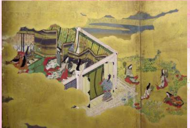
「源氏物語」 屏風(部分) 江戸時代