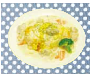
オムライス (チキンクリーム)