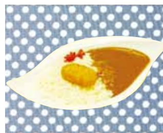
ビーフカレー (カニコロケ付)