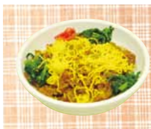
漬け込み牛焼肉丼

場所 7号館地下1F 学生食堂リリブ 11:00～14:30 (ラストオーダー 14:00)