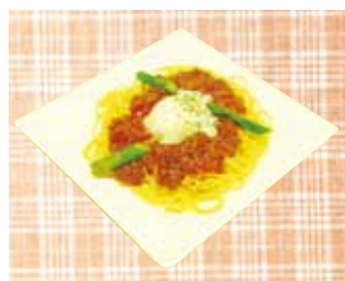
温玉ミートソース