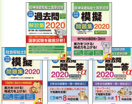
※上記書籍 2020 分と 2021 分のコンテンツを収録！

A: ご購入後にお渡しする利用コードを登録した日から、1 年間となります。詳細については、小社営業担当者までお尋ねください。