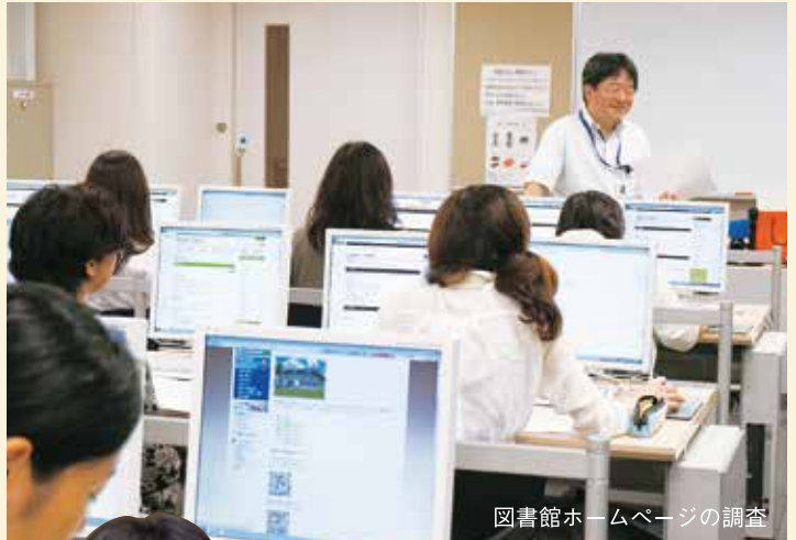
図書館ホームページの調査

仲間との議論を通して、知識を確実に自分のものに「図書館サービス特論」は、図書館司書資格を目指すにあたって総復習となる科目です。過去の事例だけでなくタイムリーな事例も取り入れ、それに対する図書館のあり方を議論し、図書館サービスについて理解を深めていきます。「自分が図書館で働いていたらどうするのか」と考えることで、これまでにテキストで学んできた知識を自分の中できちんと消化し、現場で生かせるものへと変化させていくことができます。どんなにシステム化されたとしても、図書館の要は人的サービスです。利用者や、司書同士、他の図書館とのコミュニケーションをいかにとるかで図書館は大きく変わります。「体験型スクーリング」はそのコミュニケーションを学べる貴重な場なのです。授業には、初心者の方から図書館で勤めている方までいろいろな立場の学生さんが参加します。さまざまな視点の方の意見を聞くことで、必ず得るものがあるでしょう。資格取得は入口にすぎません。どんな司書になりたいのか、どんな図書館を作っていきたいのか、そのヒントが見つかる授業になればと考えています。