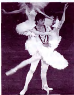
▲H2、6、19・20 ソビエト国立キエフ・バレエ団