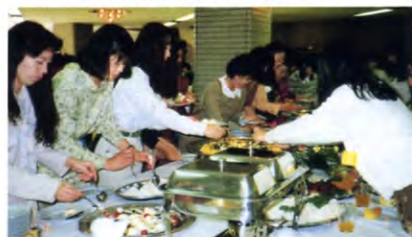
おいしいごちそうに、話はずんで!!