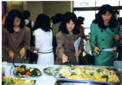
昨年、母校での総会・懇親会の一コマ

※経費の半額を香和会が負担しております。皆様よりいただく会費は半額になっております。 ※お子様料金をいただくことになりました。お子様連れの方も是非、ご出席下さい。本年はホテル開催のため、保育室はございません。 ※同封の出欠ハガキは、9月30日までに香和会室に届きますようお願い致します。