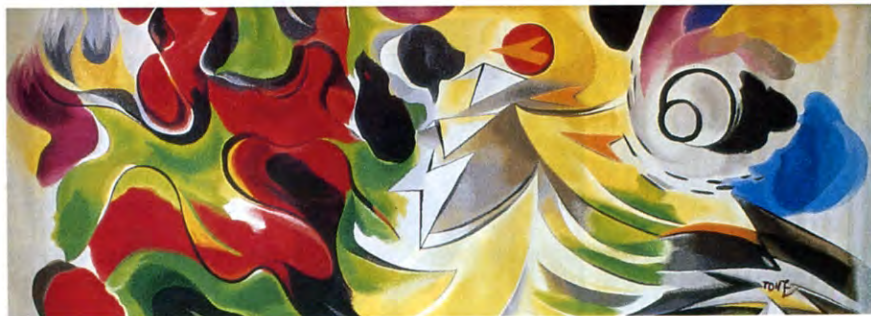
鍛板「春の祭典」聖徳大学附属聖徳中・高等学校