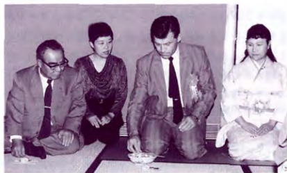
付属中・高のすばらしいお茶室での交流風景