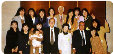
18回生 保育科K組の皆さん 総会と同時にクラス会も開催されました。