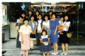
《13回生 初等教育学科E》 H5. 6. 27開催》