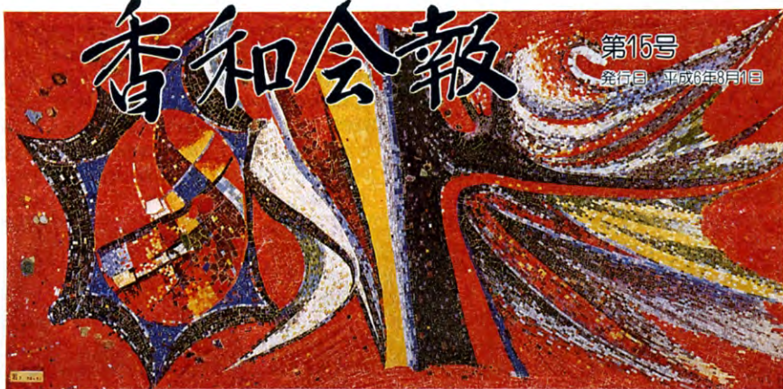
モザイク壁画「若さ」(故)利根山光人先生作 H6.4.14没 昭和40年作品 (聖徳大学 1号館ロビー)