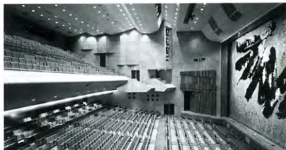
▲川並記念講堂の内部

川並記念講堂で行なわれているシリーズコンサートです。卒業生の皆様にも鑑賞していただけます。しかし授業の一環として行なわれている為、会員の皆様にも鑑賞していただける席数に限りがありますので、あらかじめご了承下さい。また鑑賞対象を香和会員（卒業生の方のみ）とさせていただきます、料金もかかります。演目により、5,000円と3,000円の二通りになります。チケットの購入方法等のお問い合わせは香和会室まで！