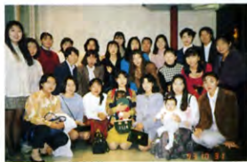
《25回生 初教・教員C》 H5. 10. 31開催》