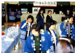
◀第1回 香和会作品展とバザー風景

また、お一人でも多くの卒業生が聖徳祭に足を運んで下さることを楽しみに待っています。