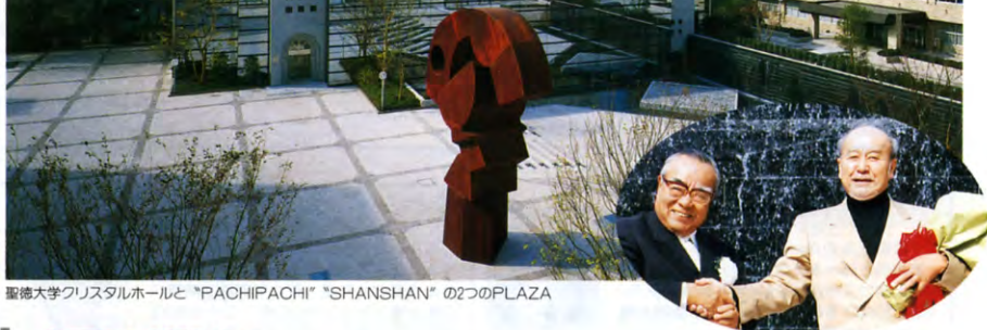
聖徳大学クリスタルホールと「PACHIPACHI」「SHANSHAN」の2つのPLAZA