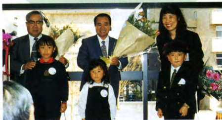
▲会場に出席してきて下さったお子様より花束贈呈