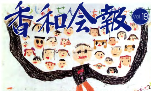
生誕100年ポスターより(聖徳大学附属第二幼稚園4才児クラスの作品です)