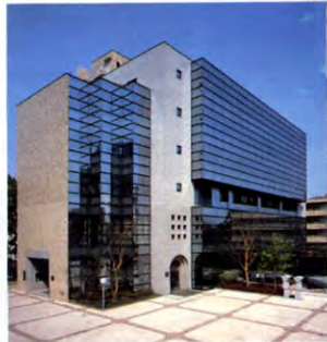
8号館 クリスタルホール