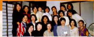
昨年パーティー 佐喜真美術館と郷土料理店「あしひJima」