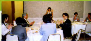
昨年パーティーでのひとこま 談話館於(甲府)