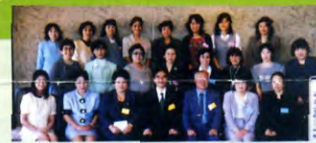
にこやかに「はい、チーズ!」