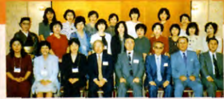
昨年パーティー 長岡ニューオータニ於(新潟)