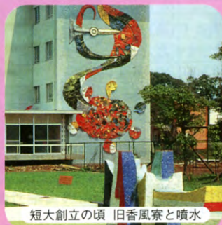
短大創立の頃 旧香風寮と噴水