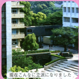
現在こんなに立派になりました