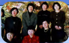
今年の支部パーティー

平成12年11月4日(土) 14:00~16:00 山中湖セミナーハウス(宿泊可)