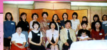
今年の支部パーティー