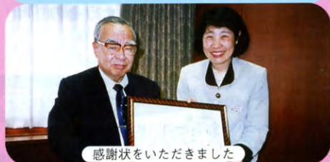
感謝状をいただきました

学長先生 今年は、あと1年で21世紀がやってきます。たくさん夢はありますが、大学の中心機能となる図書館とメディアセンター、幼児専門図書館、実験研究室を含んだ総合センターを新築します。「保育の聖徳」にしかない、世界的にも貴重な“不思議の国のアリス”の文献を収集した「アリス館」を作りたいですね。ぜひ卒業生の皆様のご協力をお願いします。