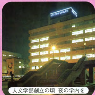
人文学部創立の頃 夜の学内を