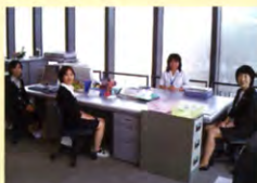
「ぜひ一度いらしてください」香和会事務局

心より感謝致します。また、香和会は、4月より事務室を10号館11階へ移転し、6月に本格的スタートを切った幼稚園から大学院までの同窓会連合会へ参加、中核を荷っています。又北関東、南関東支部設立で7支部と充実を図りますので、ぜひ御参加と御協力をお願い致します。