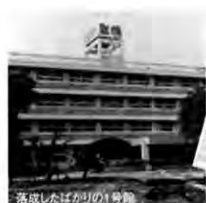
落成したばかりの1号館