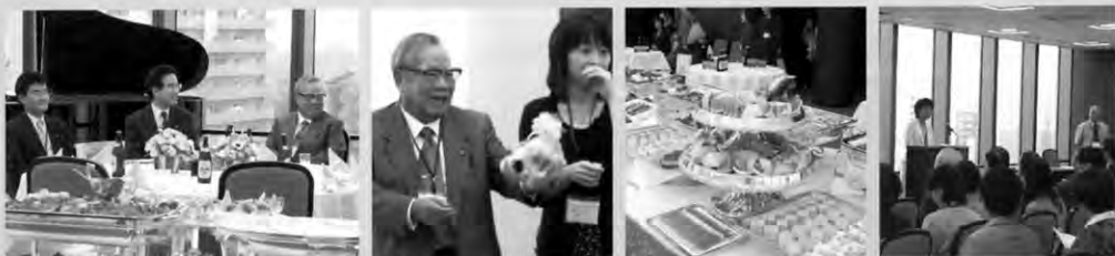
学園長、副学園長、附属中・高校長。みんな満面の笑み。 学園長先生からリッキーのプレゼント。 さすがはニューオータニの料理。 10号館12階で行われた総会。