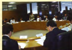
6/4 同窓会連合会役員会にて