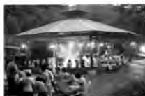
バーベキュー広場

〒384-2205 長野県北佐久市春日 春日温泉 TEL 0267-52-2111 FAX 0267-52-2119 URL http://www.sas.jains.or.jp/~kasugaso/ MAIL kasugaso@sas.jains.or.jp (かすが荘フロント)