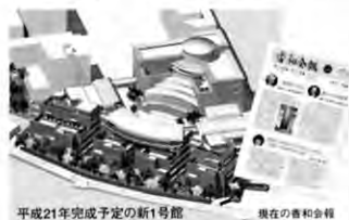
平成21年完成予定の新1号館

毎号「卒業生の活躍」をお知らせしている「わわわ」ですが、今回は短大創立40周年・学部創立15周年を記念して「母校の発展」の特集です。松戸相模台にできたてほやほやの聖徳1号館、「香和会報」の創刊号。どちらも貴重な写真です。懐かしいと言う方もいらっしゃるのでは? そして現在の、未来の聖徳。建設中の新1号館。時代とともに、みなさんとともに聖徳は常に発展し続けています。「わたしも母校に負けないくらいがんばっています!」と言う方はぜひ、ご一報ください!「わわわ」で報告できるチャンスですよ!