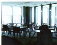
13階・レストラン「スパンカ」