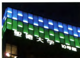
聖徳大学10号館(ライトアップ)

確かに女性は男性より長生きを数字の上ではしていますが、毎年数例ですが、卒業生の悲しいニュースを耳にします。どうぞ、皆様も健康に注意すると同時に学生時代の友人との交流でお互いの幸せと長生きのため、香和会を利用しませんか。