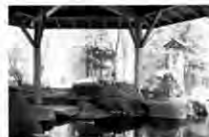
露天風呂 白樺の湯