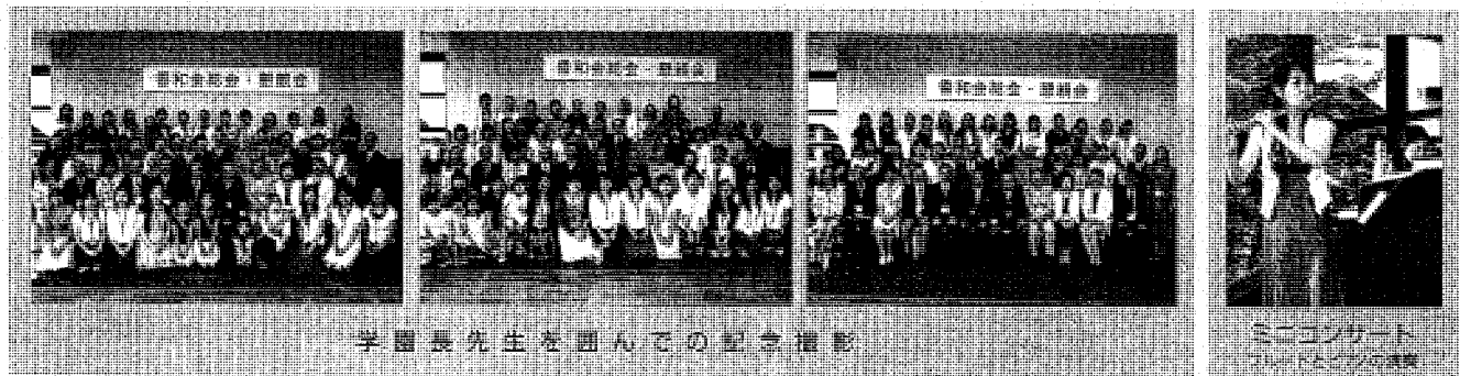
学園長先生を囲むでの記念撮影