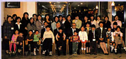
平成17年度 北関東支部パーティー ホテルカンコーにて

北関東支部は、茨城・栃木・群馬・埼玉の四県で、昨年支部を設立しました。今年初めて11月19日(日)支部パーティーを、土浦のホテルCANKOHで開催します。お子様連れの御参加をお待ちしています。支部の活動に於いては、まだこれから色々な支部の皆様の活動を勉強させて頂いて、それぞれの県の特徴を大切にして会員の皆様の為のより良い活動をして行きたいと思っておりますので、御協力をよろしくお願い致します。