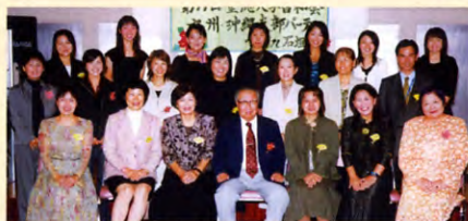
平成17年度 九州・沖縄支部パーティー 全日空ホテル石垣にて