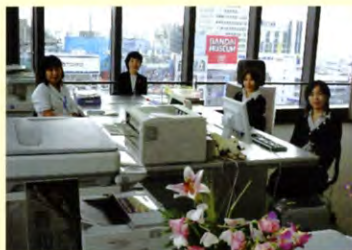
「ぜひ一度いらしてください」香和会事務室

“おかげ様で40年、ひろげよう心の和”を合言葉に、香和会の活性化、大学支援や社会貢献も含め、「(仮)40周年記念準備委員会」を設置、検討、実施します。40年の歴史を見つめ、全国7支部の完成充実。そして素敵な40周年記念事業(海外研修含む)にぜひご協力と共にご期待下さい。