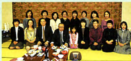
平成17年度 甲州・中部・東海支部パーティー いでゆ荘にて