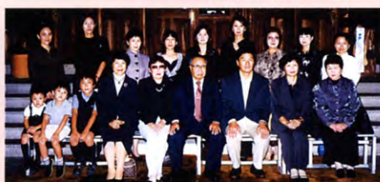
平成17年度 近畿・中国・四国支部パーティー 奈良ホテルにて

支部会員の皆様お元気ですか?今年の支部パーティーは他府県から参加しやすい交通アクセスの良い水の都、伝統のある大阪帝国ホテルで企画致しました。淀川を往來する観光船を眺めビジネス街から少し離れた静寂さ、中之島公園を背景に学園長先生と和やかな時を過ごしたり、旧友との楽しい再会に大きな感動を体験したり、又クラリネット演奏等も計画しております。是非沢山の会員皆様、ふるっの御参加をお待ち致しております。