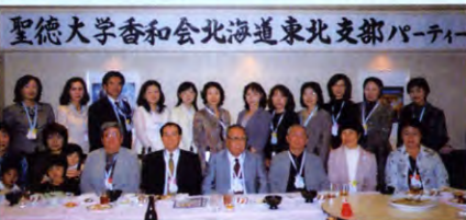
平成17年度 北海道・東北支部パーティー ホテルルイズにて