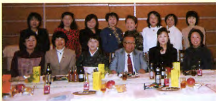
平成17年度 北陸・上信越支部パーティー メルパルクにて

会員の皆様、お元気で過ごされたことと思います。昨年10月長野市で支部パーティーを開催致しました。当日は、お天気にも恵まれ、遠くの方々の紅葉が一段と色鮮やかで、私達の目を楽しませてくれました。