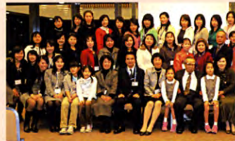
平成17年度 南関東支部パーティー 聖徳大学10

日時：平成18年11月19日(日) 受付13:30～ 開会14:00～16:00 場所：土浦ホテルCANKOH 1F カフェレストラン(ZAZA) 茨城県土浦市川口2-11-31 (JR土浦駅東口より徒歩5分) ☎ 029-821-5110 会費：1,000円 ※申込締切：9月20日(水)