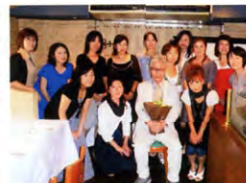
29回生 保育科 Gクラス H21年6月27日 東京 イタリアンダイニング ELSA