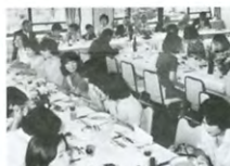
上野精養軒にて10周年総会開催