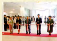
モザイクタイル壁画「若さ」テークカット

会員126名、子ども30名、先生方23名、計179名のみなさまのご参加をいただきました。