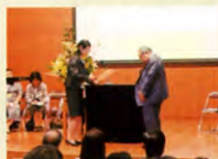
学園長先生へ感謝状贈呈