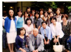
12回生 保育科 Jクラス H21年5月23日 上野 讃松亭