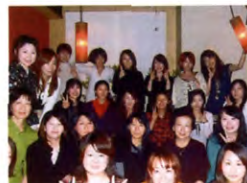
G12回生 音楽文化学科 Bクラス H20年11月2日 個室ダイニング 粋 松戸店