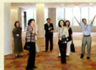
新1号館見学ツアー