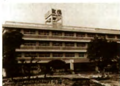
落成したばかりの1号館