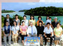
創立40周年記念沖縄離島フレンドシップツアー