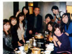
34回生 生活文化学科 Aクラス H20年11月15日 949柏東口店