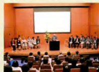
香和会40周年記念総会