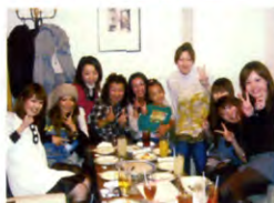
33回生 保育科 クラス H20年11月2日 カラオケ館パーティー オペラ