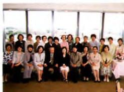
2回生 保育科 A・Bクラス H21年5月6日 聖徳大学10号館 ラウンジローカス