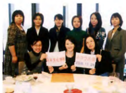
G66回生 日本文化学科 クラス H20年11月24日 聖徳大学10号館13階 スパンカ