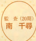
監査 (20期) 南 千尋