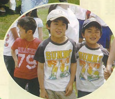
卒業生の子供たち