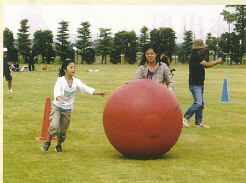
平成21年度体育祭 中玉ころがし