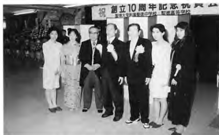
学園長先生はじめ、諸先生方を囲む 聖朋会役員（食堂での祝賀会）