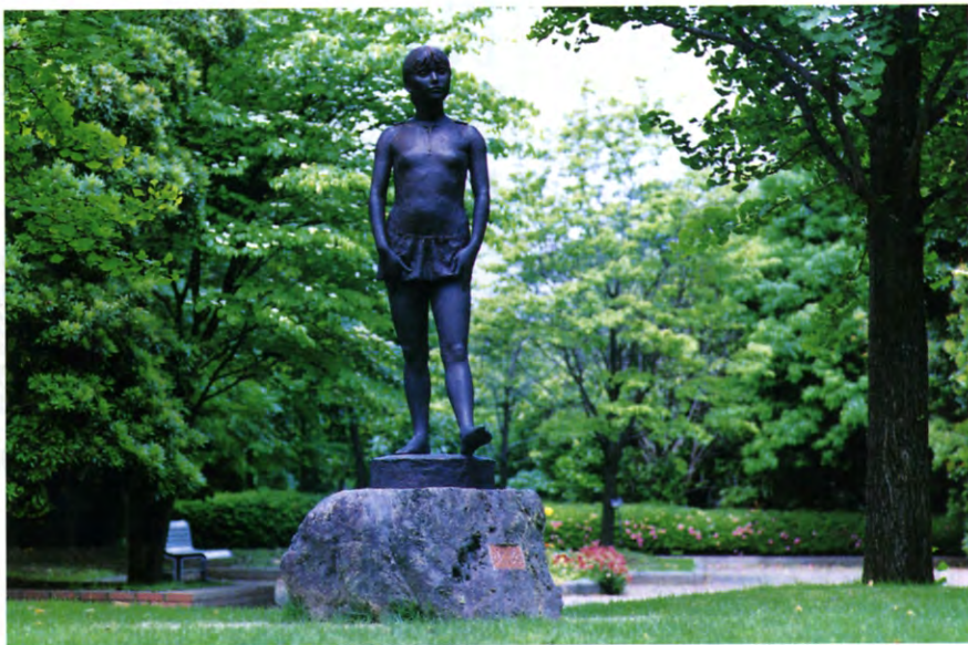
ブロンズ像「少女」聖朋会寄贈