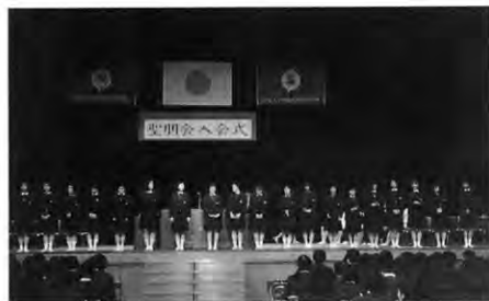
聖朋会入会式（平成7年3月）