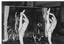
大鏡の前で練習する新体操部