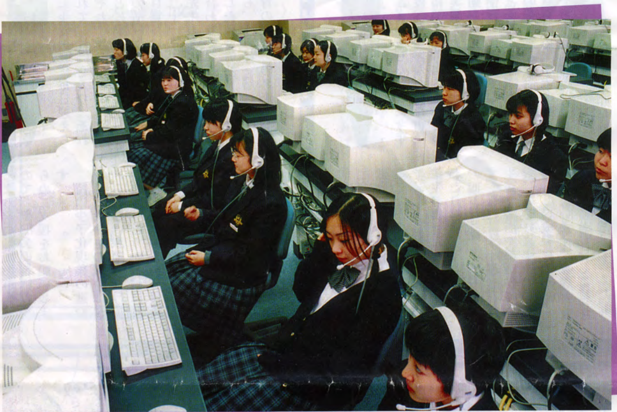
パソコン授業風景