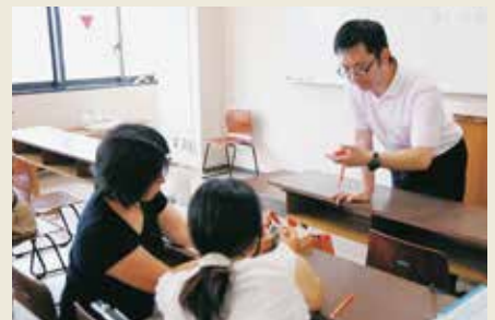
「心理検査実習I」の授業風景