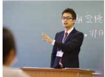
矢口先生が担当している「感覚・知覚心理学」の授業風景。受講者は人間の知覚メカニズムについて学び、身体の仕組みから心の働きを探る。

活用できるもの。営業やマーケティングなどあらゆる職種で、そして家族や友人などとの人間関係で役立てられます。人生を豊かにしてくれる知識が学べるのも心理学ならではのですね。